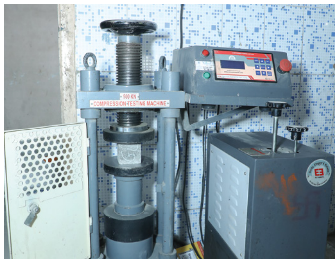
Compressive Strength Machine