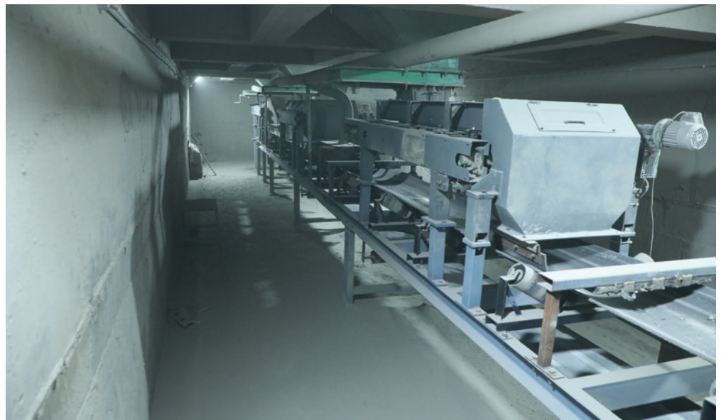
Automatic Weigh Feeding System